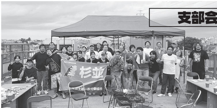
初参加者が多く参加