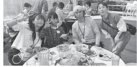
堀江さんご家族「この後は遊園地を楽しみます」