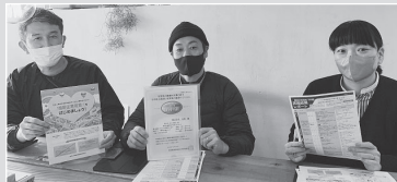
(株)水雅のみなさん 健康企業宣言申請中です

東京土建国保は建設産業で働くみなさんと家族の健康 を守り、頼りにされる国保組合をめざしています。健診を はじめとする保健事業のご案内です。